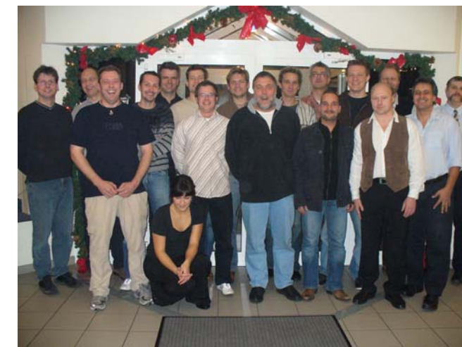
In gelöster Stimmung trifft sich ein Grossteil der diesjährigen Teilnehmer zum Gruppenfoto im Foyer des NKF-Hotels.

In diesem Jahr haben 20 Teilnehmer die Schule mit dem weltweit anerkannten Carrier-Zertifikat nach bestandenen Prüfungen verlassen.