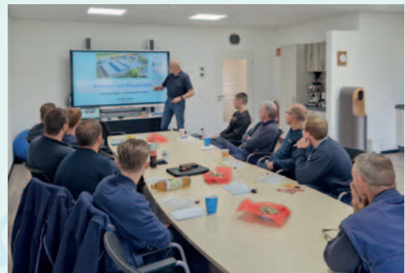
Jährliche Unterweisung der Mitarbeiter