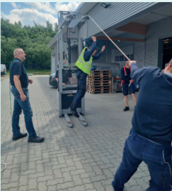
Unterweisung Persönliche Schutzausrüstung (PSA)

Der Unternehmer hat die Versicherten über Sicherheit und Gesundheitsschutz bei der Arbeit, insbesondere über die Gefährdungen und Maßnahmen zur Verhütung mindestens einmal jährlich zu unterweisen. Wir übernehmen das für Sie und kommen in Ihren Betrieb. Themen nach Absprache und betrieblicher Relevanz.