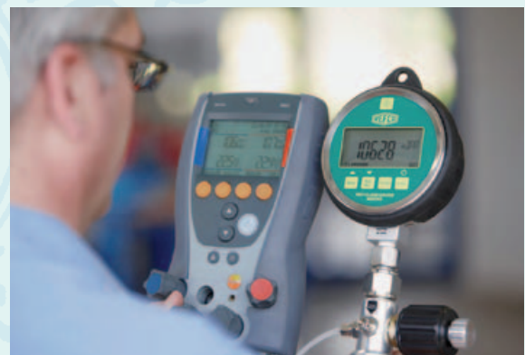
Kalibrierung der Monteurhilfen